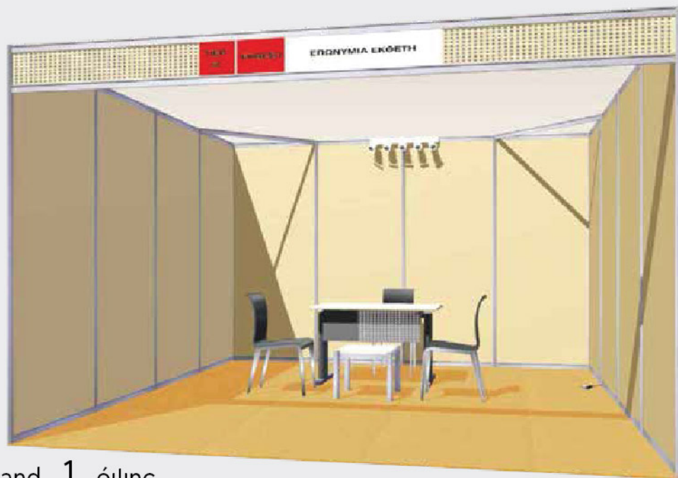
Stand 1 όψης