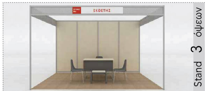
Stand 3 όψεων